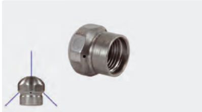
1/8" F. Ø 15 mm. Inox

Le jet frontal est destiné à déboucher ou à dégivrer les canalisations. Les jets rétroactifs sont destinés à l'effet de traction du flexible et à l'évacuation des impuretés. Acier inox. Max. 250 bar