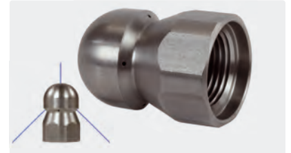
3/8" F. Ø 24 mm. Inox