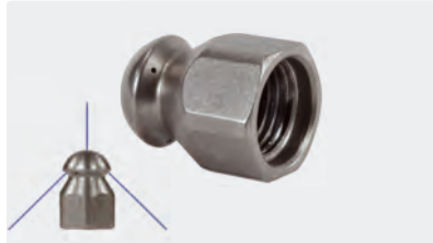
1/4" F. Ø 19 mm. Inox