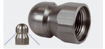
3/8" F. Ø 24 mm. Inox