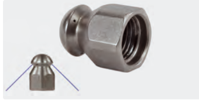
1/4" F. Ø 19 mm. Inox