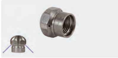
1/8" F. Ø 15 mm. Inox

Équipées de 3 ou 4 jets rétroactifs (45°) pour un effet de traction optimal et pour l'évacuation des impuretés. Acier inox. Max. 250 bar