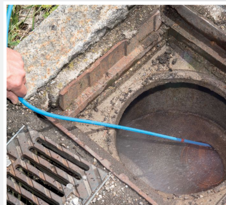
Fig. Flexible de nettoyage de canalisation